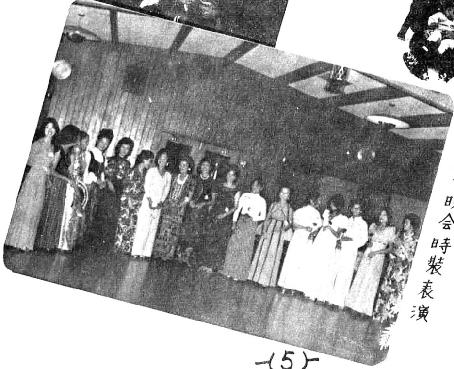
秋季晚會時裝表演