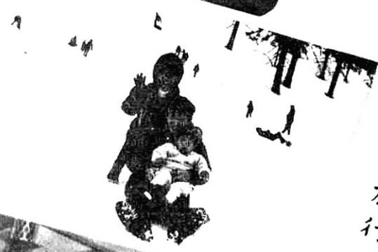
玩雪旅行 LAKE TAHOE